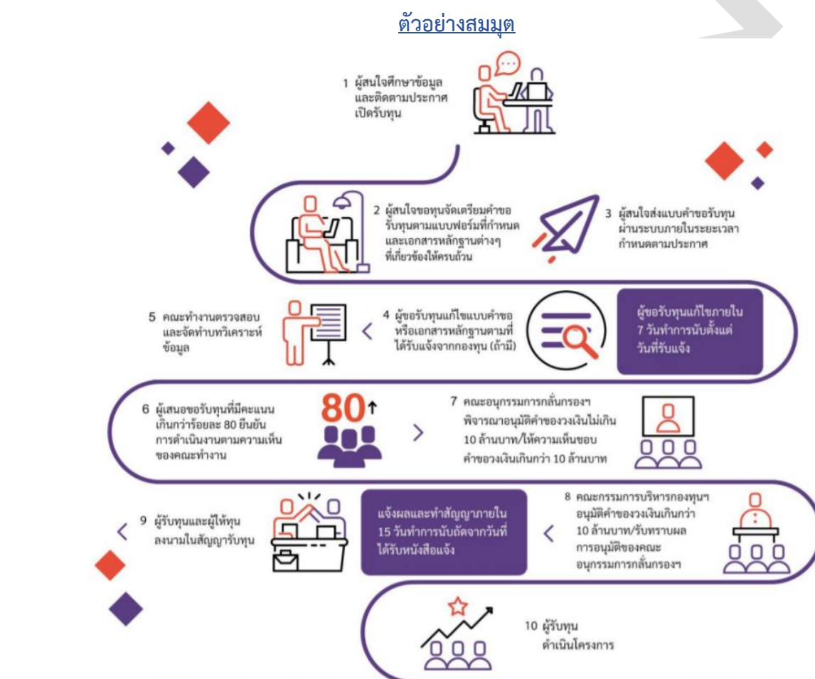
รูปที่ 1 ภาพรวมการทำงานของระบบ

(คำชี้แจง : เขียนอธิบายจำกัดหรือวางกรอบขั้นตอนการทำงานวิจัยที่ชัดเจน อาทิ การเก็บข้อมูล การกำหนดพื้นที่ ประชากรตัวอย่าง การสุ่มตัวอย่าง ขั้นตอนและวิธีการในการวิเคราะห์ข้อมูล ฯลฯ รวมทั้งระบุสถานที่ที่จะใช้เป็นที่ทำการวิจัย / เก็บข้อมูลให้ครบถ้วนและชัดเจนเพื่อประโยชน์ในการเสนอของบประมาณ)